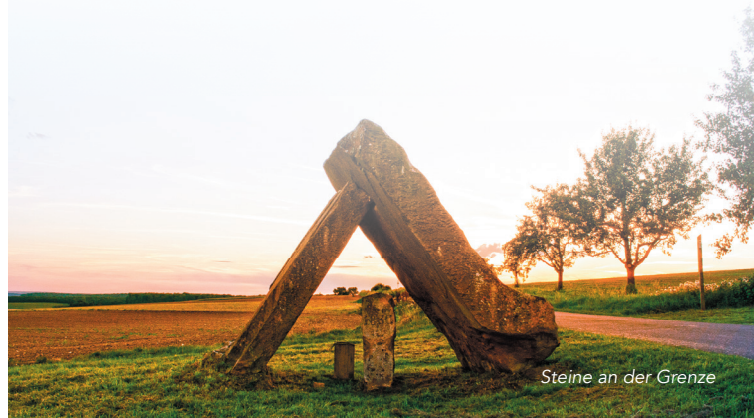
Steine an der Grenze

Lohnenswert ist auch der Blick ins Feinmechanische Museum Fellenbergmühle . Hier zog in eine ehemalige Mahlmühle eine feinmechanische Werkstatt ein, dessen Maschinen auch heute noch funktionieren.