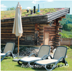
Außensauna - Das BAD

Ob Wasserspaß für die ganze Familie oder Entspannung für Erholungssuchende – in DAS BAD findet jeder seine Wasserwelt.