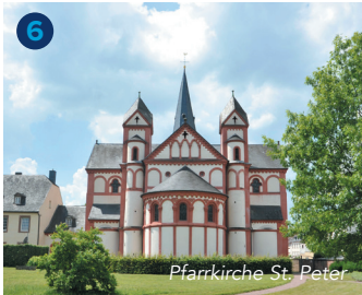
Pfarrkirche St. Peter