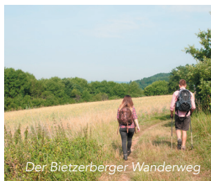
Der Bietzerberger Wanderweg

Facettenreich in Natur und Kultur präsentiert sich der „Bietzerberger“ und überrascht mit einer Vielfaltigkeit der Natur, wenn der Weg durch eine Obstplantage oder entlang von Orchideenwiesen führt. Das historische Mühltal oder die Sonnensteine laden zur kleinen Denkpause ein.