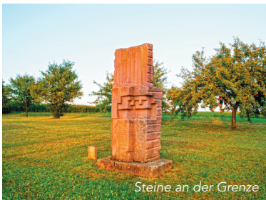
Steine an der Grenze

Zu einem der bedeutendsten Spätrenaissance-Bauten gehört das Wahrzeichen Merzigs, das Stadthaus . Hier finden Besucher im Inneren eine ganz besondere Sehenswürdigkeit. Seit 1998 sind hier 16 Terrakotten von Villeroy & Boch, angefertigt für das Schloss Herrenchiemsee, ausgestellt.