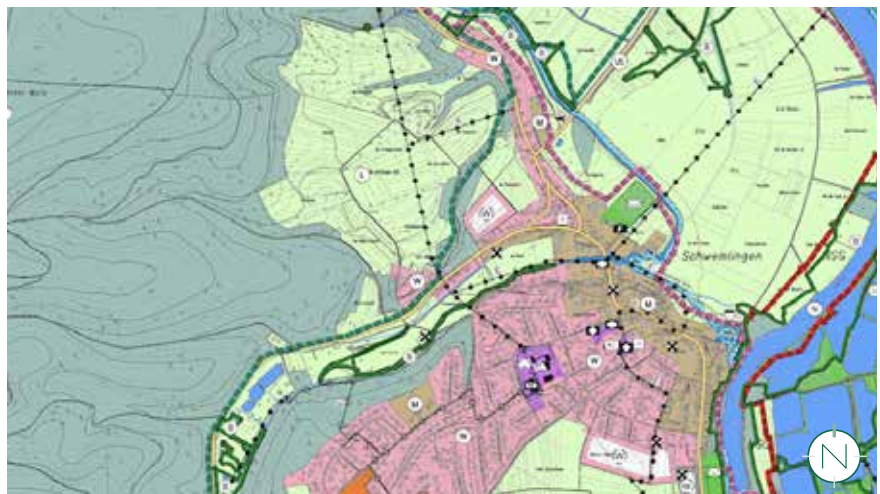
Stadtteil Schwemlingen - Auszug Flächennutzungsplan der Kreisstadt Merzig; Quelle: Kreisstadt Merzig