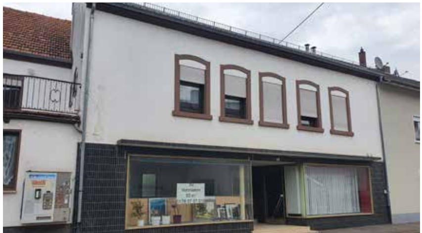
Gewerblicher Leerstand im Bereich der Ortsdurchfahrt „Luxemburger Straße“ (L 170)