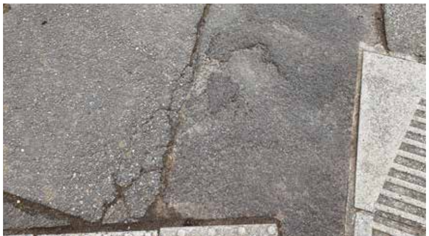
Missstand: sanierungsbedürftiger Bürgersteig im Bereich der Ortsdurchfahrt „Luxemburger Straße“ (L 170)