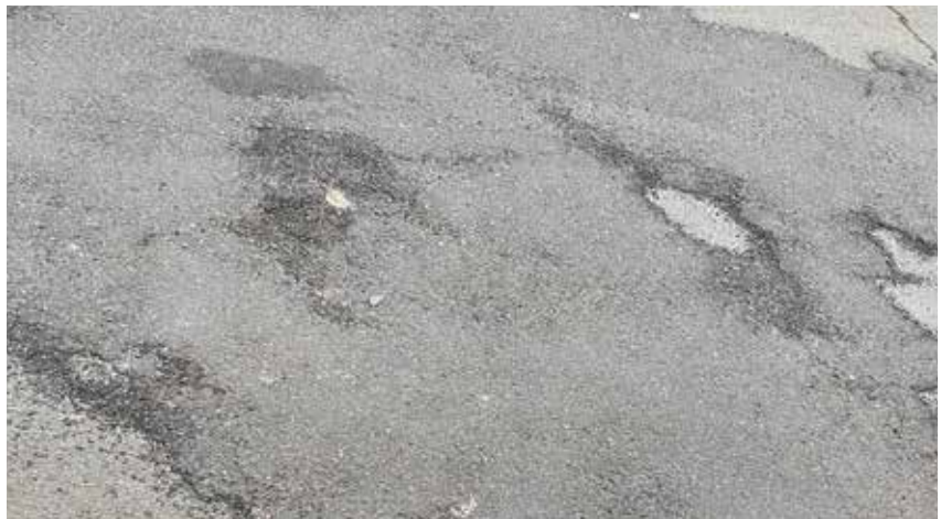
Missstand: sanierungsbedürftige Fahrbahndecken im Bereich der Straße „Im Ecken“