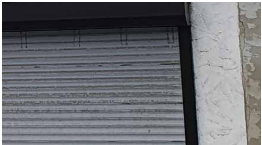
Misstand Beispiele: Materialität der Fassade/ von Garagentoren