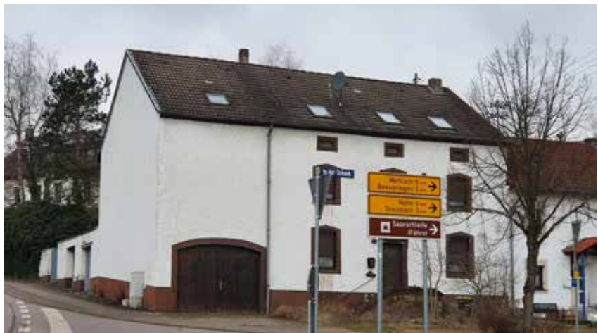
denkmalgeschütztes Gebäude im Bereich der Straße „In der Schank“ mit Sanierungs- und Aufwertungsbedarf