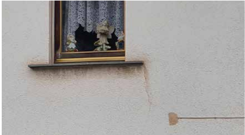
Modernisierungs- und instandsetzungsbedürftiges Gebäude mit mittlerem Bedarf