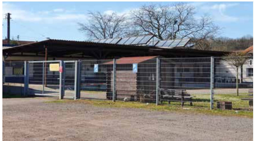
Bereich am Sportplatz (u.a. Clubheim inkl. Vorflächen) mit Sanierungs- und Aufwertungsbedarf