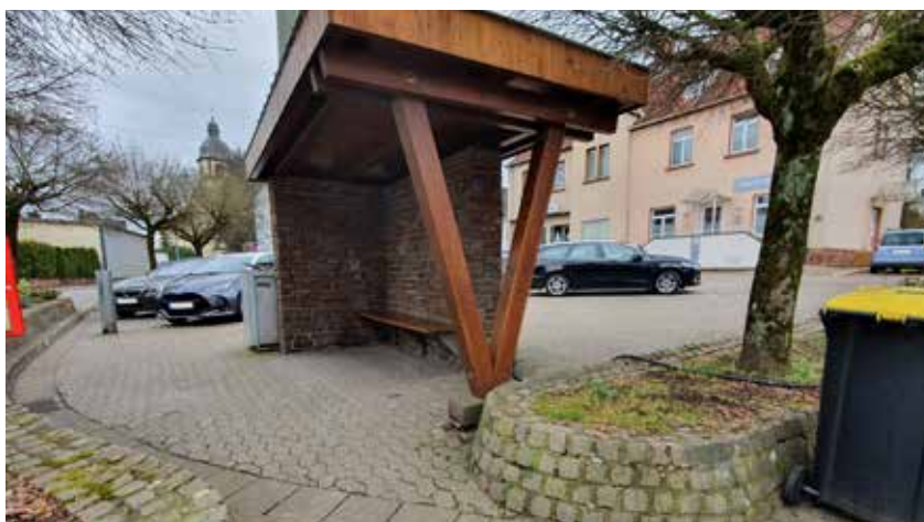
Platzfläche mit Aufwertungsbedarf im Kreuzungsbereich Luxemburger Straße/ Laurentiusstraße/ „Zum Schotzberg“