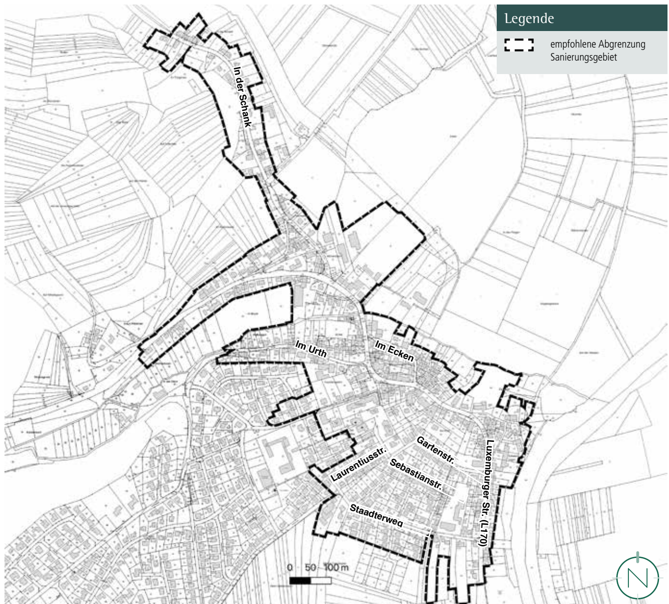
Empfohlene Abgrenzung des Sanierungsgebietes; Quelle: Kreisstadt Merzig; Geobasisdaten, @ LVGL MZG 007/04; Bearbeitung: Kernplan

Wie anhand des Analyseplans zu erkennen ist, bestehen die städtebaulichen Missstände nicht nur auf den einzelnen Grundstücken, sondern sind über das gesamte Untersuchungsgebiet verteilt. Aus diesem Grund wird vorgeschlagen, das Untersuchungsgebiet vollständig als Sanierungsgebiet auszuweisen.