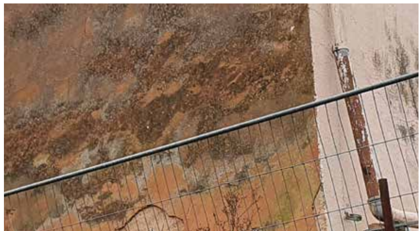
Modernisierungs- und instandsetzungsbedürftiges Gebäude mit hohem Bedarf