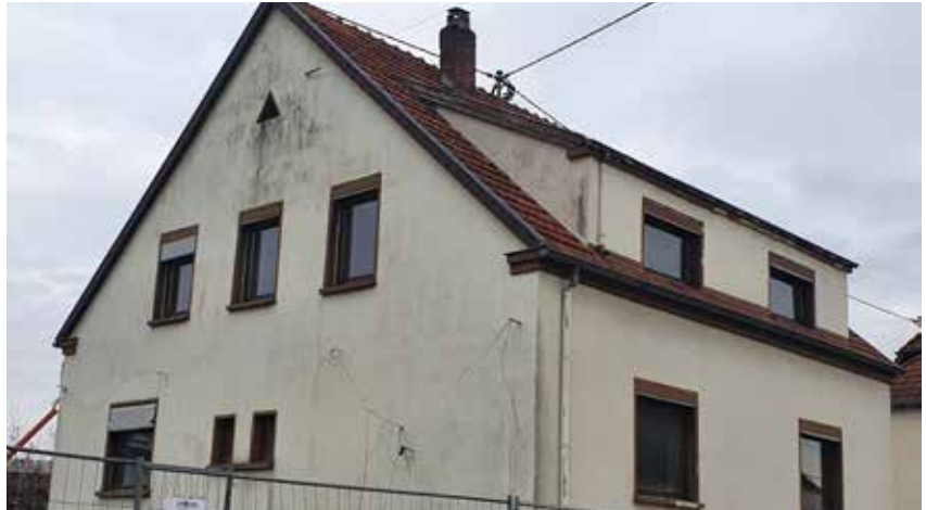
Leerstehendes Wohngebäude im Bereich der Laurentiusstraße