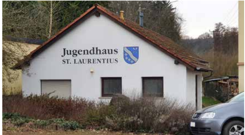
sanierungs- und aufwertungsbedürftiges Jugendhaus samt Hoffläche im Bereich der Ortsdurchfahrt „Luxemburger Straße“ (L 170)