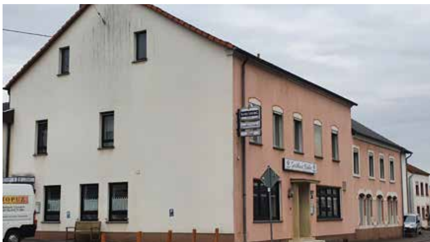
Gasthaus mit Sanierungs- und Aufwertungsbedarf im Kreuzungsbereich Luxemburger Straße (L 170)/ Gartenstraße