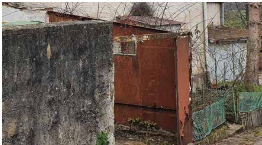
Ortsbildbeeinträchtigende Gestaltung von Gebäudevorflächen/ Nutzung unbebauter Grundstücksflächen