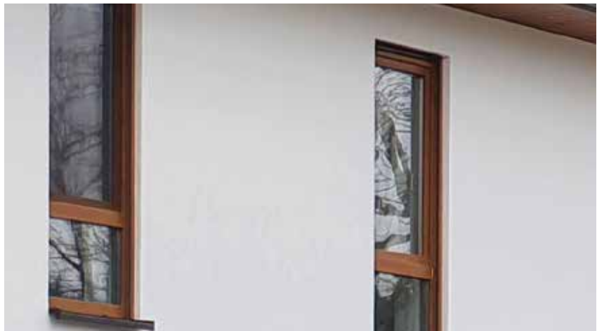
Modernisierungs- und instandsetzungsbedürftiges Gebäude mit geringem Bedarf